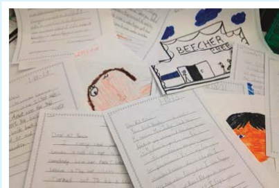
Pisma autorici R.J. Palacio

Učenici škole Greenwich Academy u Greenwichu, Connecticutu, napravili su „Jamu čuda“ kako bi pomogli učenicima pričati o prijateljstvu i dobroti!