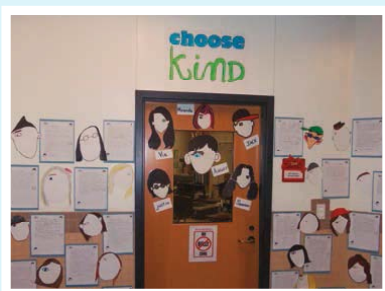
Osnovna škola Paris u Maineu Izaberi dobrotu prije nego što uđeš!