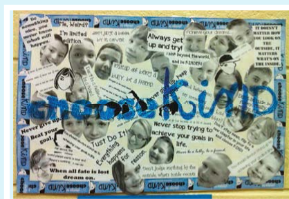
Javna škola Rose Eaton Oglasna ploča s mudrim izrekama